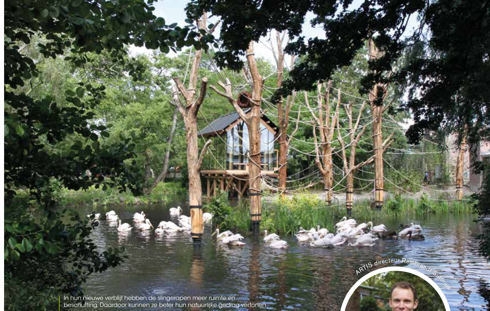
In hun nieuwe verblijf hebben de slingerapen meer ruimte en beschutting. Daardoor kunnen ze beter hun natuurlijke gedrag vertonen