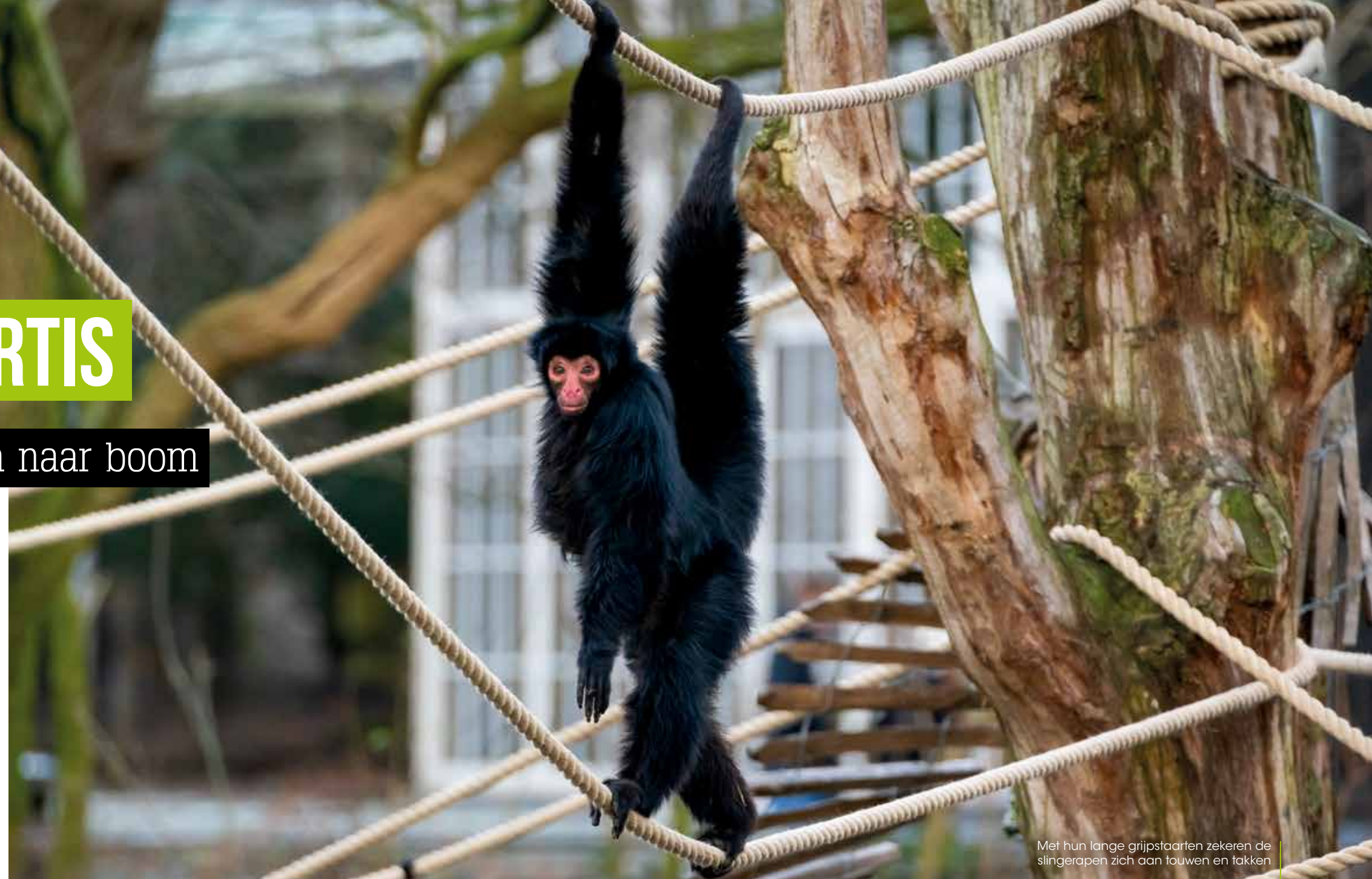
Met hun lange grijpstaarten zekeren de slingerapen zich aan touwen en takken

'Het is geweldig dat de slingerapen nu acht meter de lucht in kunnen'