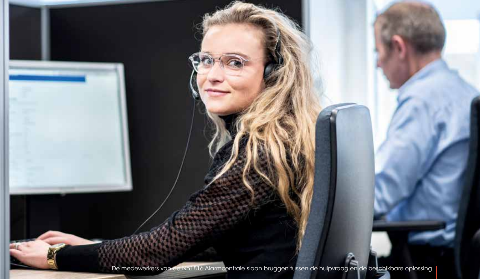
De medewerkers van de Nh1816 Alarmcentrale slaan bruggen tussen de hulpvraag en de beschikbare oplossing

Een bijzondere situatie, die Tamara is bijgebleven, betreft een man in Zuid-Amerika, die al geruime tijd in het ziekenhuis lag (de man had overigens geen corona) en tijdens de vlucht naar Nederland extra ondersteuning nodig had. Normaal stuurt Nederland in die omstandigheden een medisch escort om de patiënt te begeleiden. Maar het