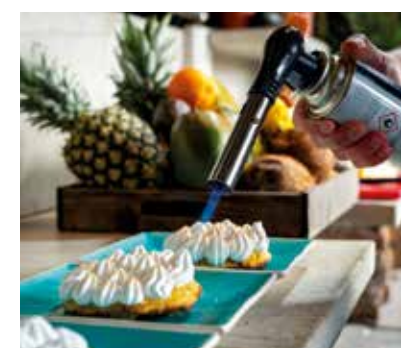
Met een brander kleurt Boon de toefjes eiwitwischium op zijn ananastaartjes